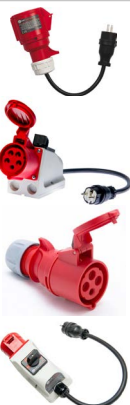
Adapter gniazd trójfazowych 32 A