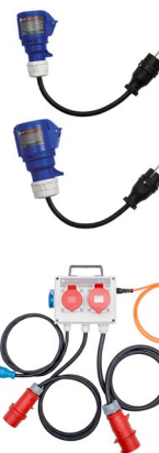
Adapter gniazd przemysłowych 3P