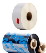
Akcesoria do drukarki SATO