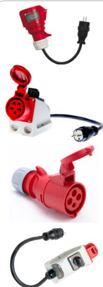
Adapter gniazd trójfazowych 16 A